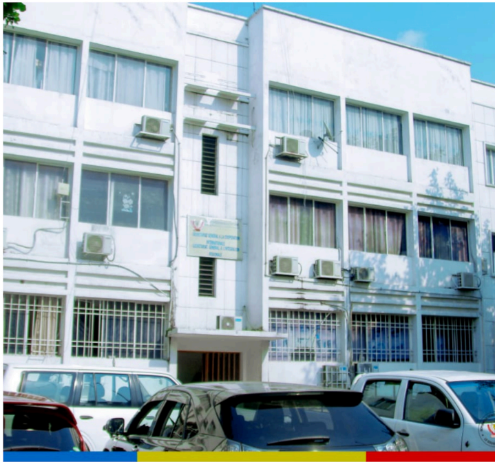
Bâtiment Administratif de la C.I.