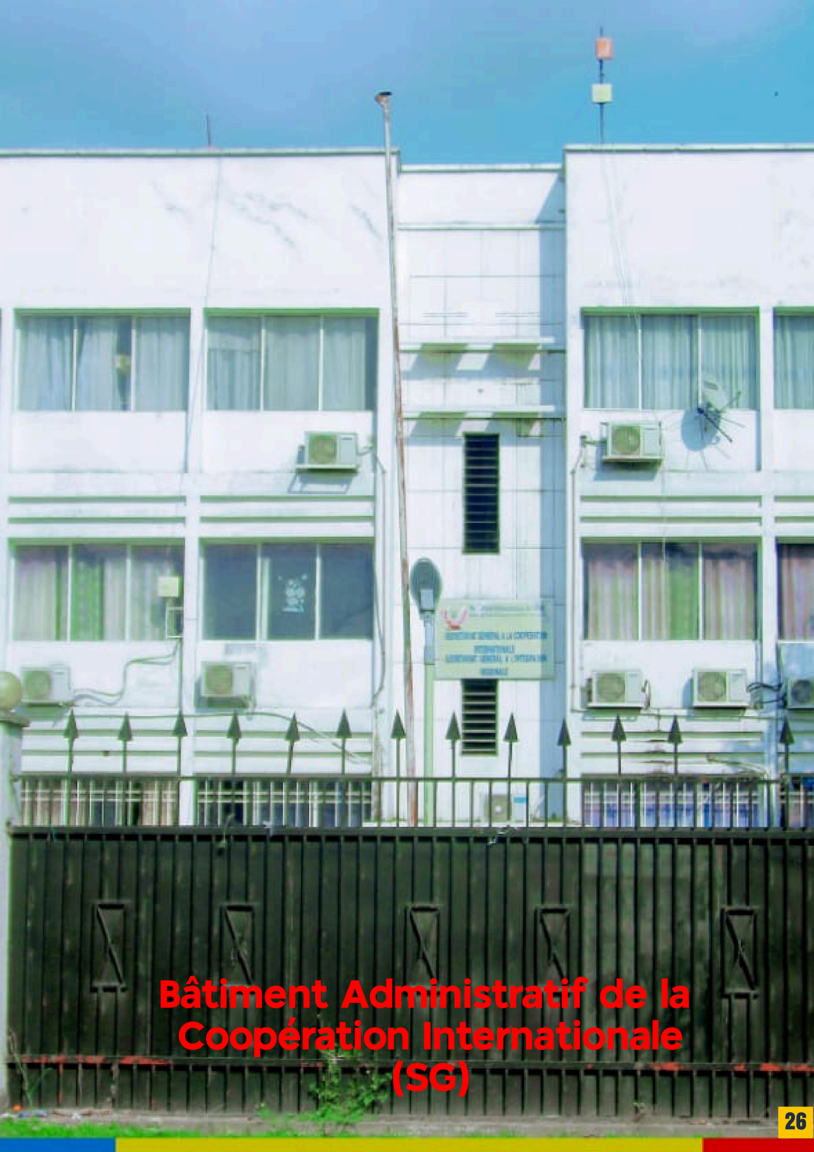
Bâtiment Administratif de la Coopération Internationale (SG)