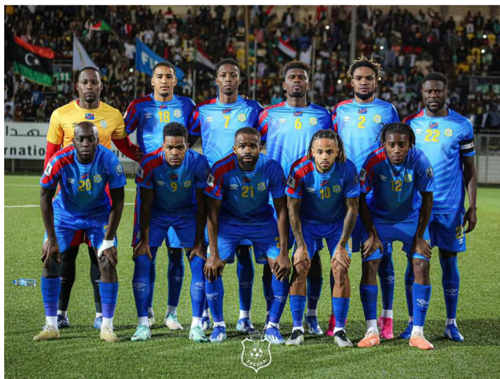
L'équipe de Léopards Congolais