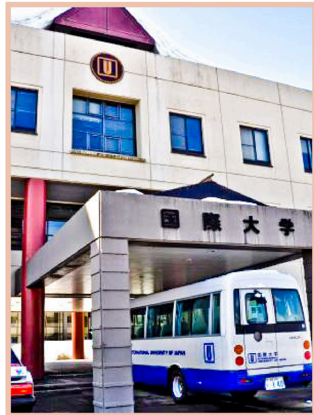
International University of Japan Niigata, Minamionuma city, Japan