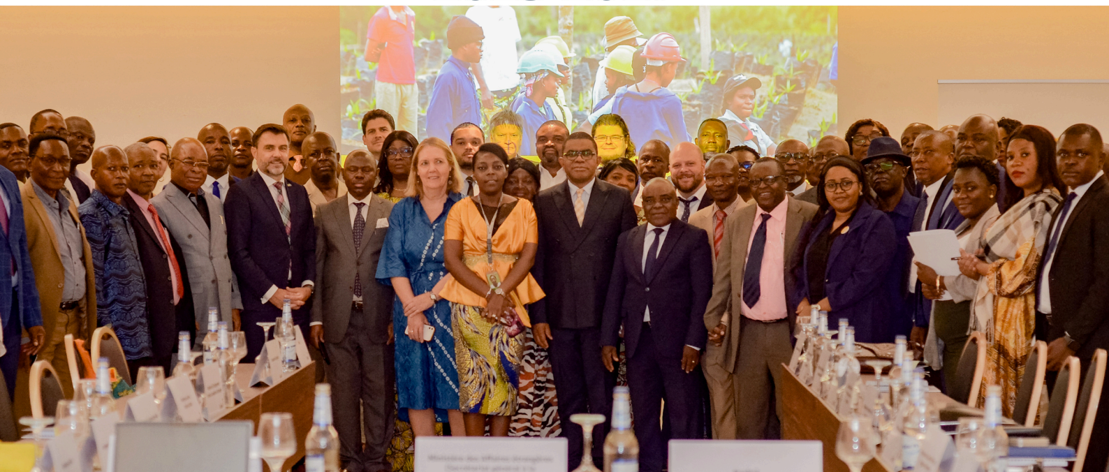
Une vue générale des participants à Pullman Hôtel

LE SECRÉTAIRE GÉNÉRAL À LA COOPÉRATION INTERNATIONALE M. VINCENT MUSAMBYA, A EXHORTÉ LES DIFFÉRENTS PARTENAIRES IMPLIQUÉS DANS LE NOUVEAU PROGRAMME DE COOPÉRATION (2023-2027) RDC ET L'AGENCE DE COOPÉRATION BELGE (ENABEL), À S'APPROPRIER ET À S'IMPLIQUER DANS SA MISE EN ŒUVRE AFIN DE LE FAIRE BÉNÉFICIER À LA POPULATION CONGOLAISE.