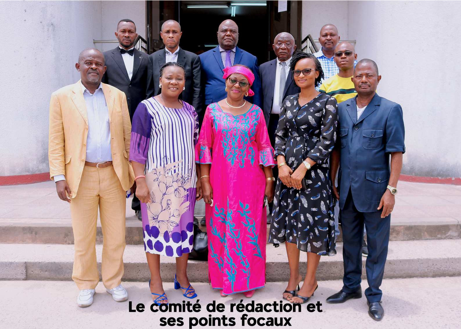
Le comité de rédaction et ses points focaux