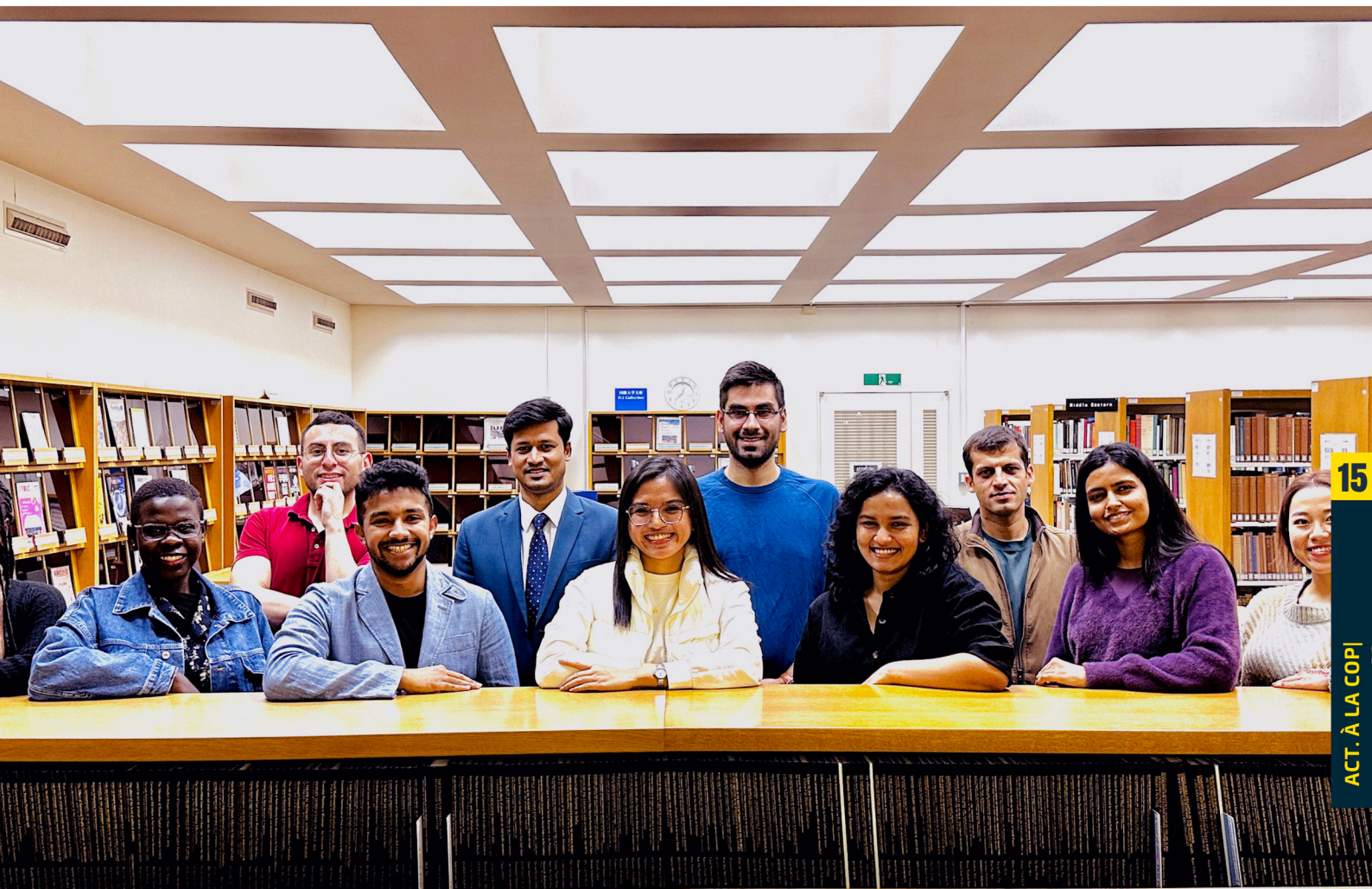
International University of Japan Niigata, Minamionuma city, Japan

Dans le cadre des activités organisées par la JICA et l'Université, les participants ont effectué des visites de terrain dans la ville de Nagasaki, au Musée mémorial de paix de la bombe Atomique américaine et la ville morte, à la préfecture de Kagoshima, à la montagne volcanique de Sakurajima et au musée de la paix de Chiran, mémorial aux kamikazes pilotes qui s'étaient sacrifiés pour freiner les navires américains pendant la deuxième guerre mondiale.