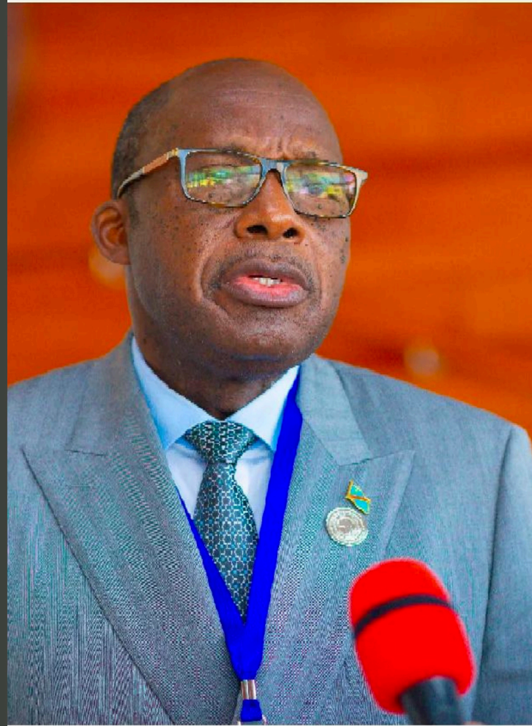
VPM Christophe LUTUNDULA Des Affaires E & Francophonie

Le Point Focal Genre a invité le Vice Premier Ministre à procéder tant soit peu à l'élévation des Hauts Fonctionnaires à la dignité d'Ambassadeurs ; à l'accréditation des Diplomates de la Coopération Internationale en poste tout en lui demandant également à ouvrir des antennes de Coopération à l'intérieur du pays et redynamiser les antennes de Coopération à l'extérieur du pays.