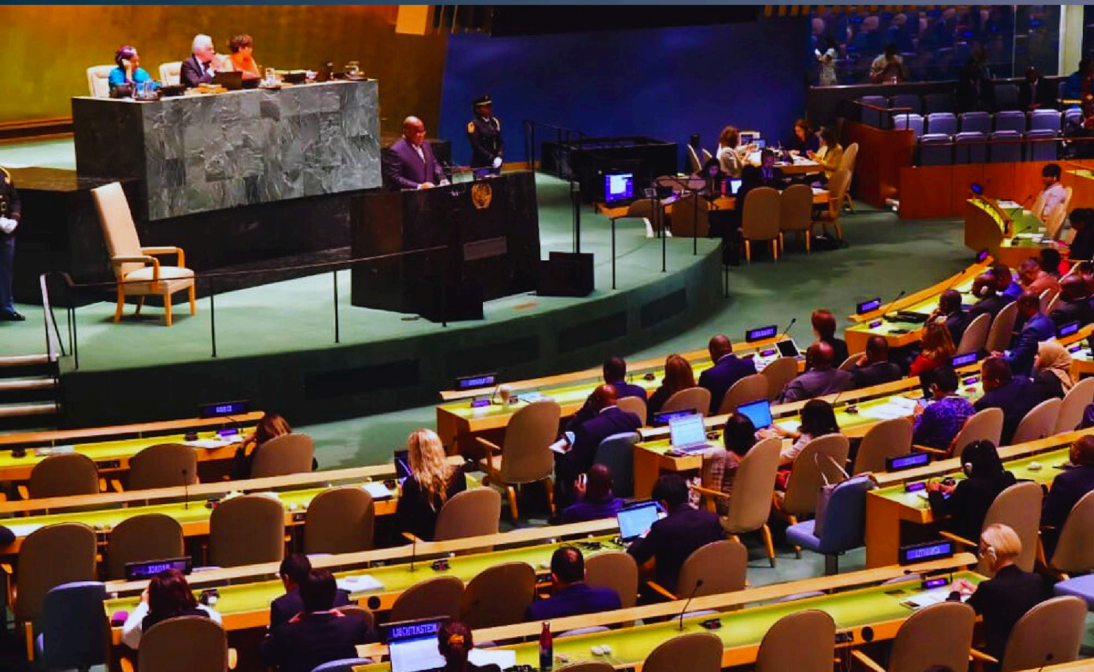
Une vue de l'Assemblée Générale de l'ONU

Dans cette même lancée, le gouvernement de la République, par l'entremise du Vice - Premier ministre, ministre des Affaires Etrangères et de la Coopération Internationale Christophe Lutundula a saisi en septembre dernier, par une correspondance diplomatique, le Conseil des Sécurité de l'ONU pour le rappel de ce retrait de la Monusco à la date de décembre 2023.