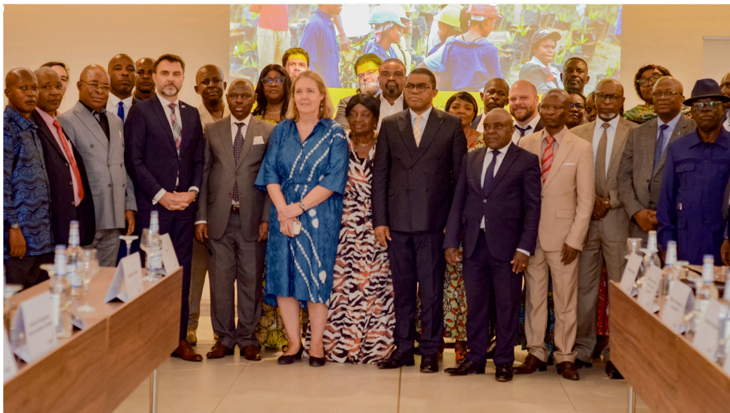
Une vue générale des participants à Pullman Hôtel

Quatre-principaux axes d'actions y sont prévus à savoir :