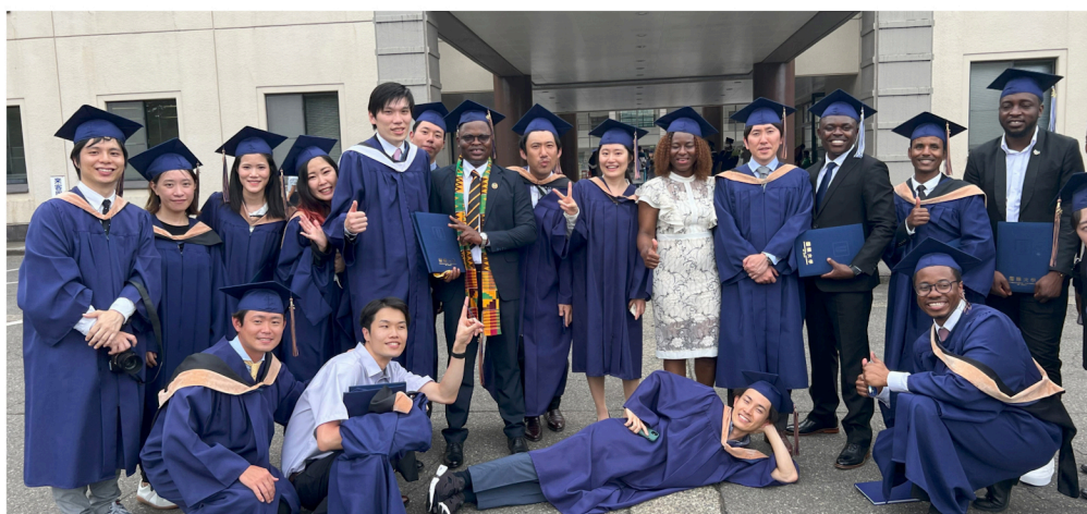
Une vue des étudiants de l'International University of Japan

C es programmes sont annoncés chaque année, les jeunes intéressés soumettent leur candidature au bureau de la JICA qui retient les meilleurs sur base d'un concours rigoureux qu'elle organise. Les candidats doivent présenter un projet d'études sur base duquel ils seront orientés. Ceux évoluant dans le secteur public doivent obtenir l'autorisation officielle de leurs institutions avant de rejoindre leurs universités.