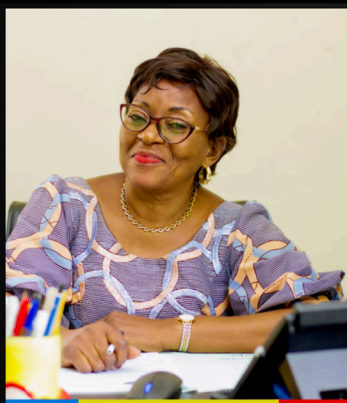
Dir. Agathe Ilunga Nzambi