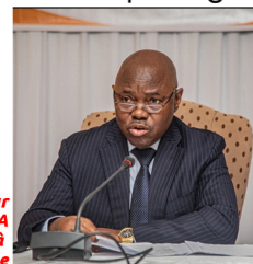
L'Ambassadeur Vincent MUSAMBYA Secrétaire Général à Coopération Internationale

C 'est dans cette optique qu'après le troisième Forum de l'Initiative la Ceinture et la Route pour la Coopération Internationale ayant regroupé près d'une centaine des pays du monde à Pékin, du 17 au 18 octobre 2023, ce rendez-vous a été pour la Chine, une manière de réaffirmer son engagement à élargir ses liens de Coopération avec des pays africains. Et ce, dans une dynamique orientée vers la recherche d'une communauté de destin partagé