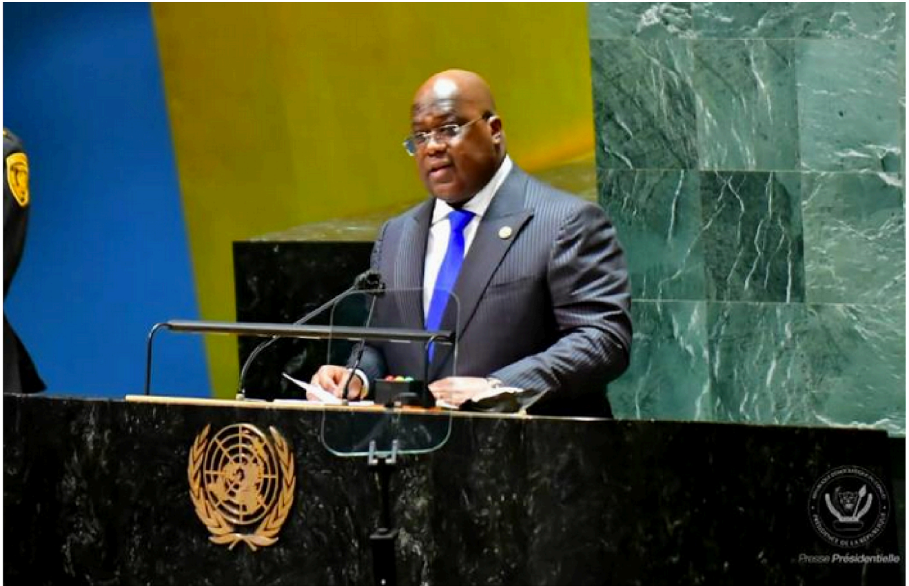
Félix Tshisekedi du haut de la tribune de l'ONU

Devant les dirigeants du monde, évalués à près de 150 Chefs d'Etat et des gouvernements, le Président de la République Félix Antoine Tshisekedi Tshilombo, du haut de la Tribune de la 78ème Session de l'Assemblée Générale de l'ONU à New-York, s'est exprimé en toute sérénité et sincérité.