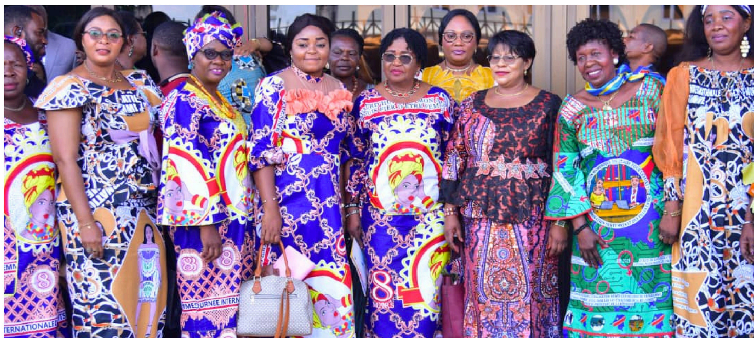
Une vue des femmes participantes à la 3ème Édition du FIFAF

Quant à la troisième journée, elle a été consacrée aux travaux en ateliers à l'issue desquels des recommandations ont été formulées aux autorités du pays. Il s'agit entre autres : la mise en œuvre des mécanismes nécessaires pouvant aider les Femmes à quitter l'informel vers le formel, aider les Femmes qui œuvrent dans les domaines agricoles d'intégrer les associations de leur domaine; de travail et les coopératives, la mise en place des mécanismes de manière à sécuriser les projets des Femmes déposés à l'ANADEC, assurer les conditionnements des produits fabriqués par les Femmes du FIFAF, mener des études sur l'évacuation des produits abandonnés au plateau de BATEKE à cause de l'insécurité.