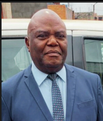
Dir. Luc Madinda TSHONGU

Une Revue trimestrielle produite par le Secrétariat général à la Coopération Internationale