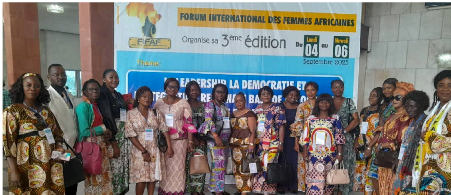
Une vue des femmes participantes à la 3ème Édition du FIFAF

L es Femmes du Secrétariat Général à la Coopération Internationale ont pris une part active à la troisième édition du Forum International des Femmes Africaines, FIFAF en sigle, tenue du 4 au 8 septembre 2023 en la salle des spectacles du Palais du Peuple à Kinshasa. Ce forum, qui a réuni des femmes leaders de divers pays africains venues de différents secteurs, avait pour thème «Le leadership, la démocratie et l'intégration régionale, base d'une économie inclusive». Cette troisième édition a été organisée à la suite des activités de la Journée Internationale de la Femme Africaine, célébrée le 31 Juillet de chaque année sous le patronage de Madame la Ministre du Genre, Famille et Enfant, Mireille MASANGU BIBI MULOKO.